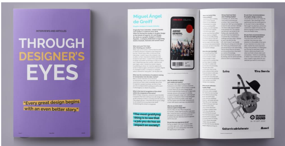
Slika 3: Editorial - del brošure